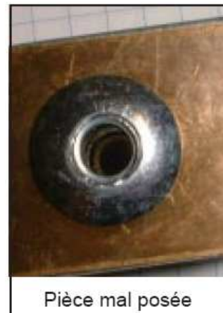
Pièce mal posée