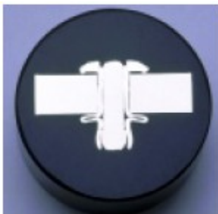
Coupe du rivet après pose

Lorsque le rivet est mis en œuvre en respectant les consignes de pose , l'indice de protection du rivet posé est : I.P. 6.5.